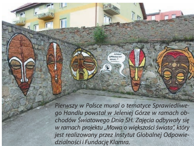
Pierwszy w Polsce mural o tematyce Sprawiedliwego Handlu powstał w Jeleniej Górze w ramach obchodów Światowego Dnia SH. Zajęcia odbywały się w ramach projektu „Mowa o większości świata”, który jest realizowany przez Instytut Globalnej Odpowiedzialności i Fundację Klamra.